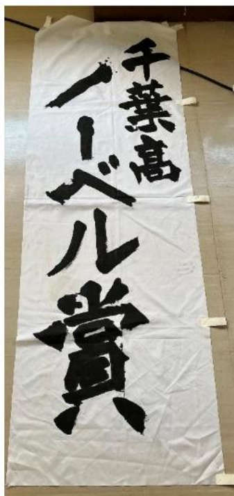
千葉高ノーベル賞